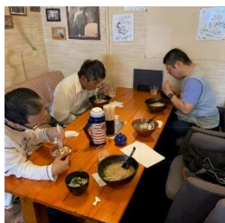
【麵処希信にて昼食】

その後、香川県防災センターで、暴風体験や消火器の使い方、火災発生時の正しい行動を教わりました。また、地震体験では震度7レベルの感覚を実際に体験しました。地震発生時に、カーテンを閉めることで、ガラスの破片が飛び散ることを防げると教わりました。それではこのあたりで。